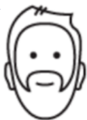
Selger 30 år

Prisene til nå har vært veldig bra og lar meg leie bilen uten å tenke på hva det koster