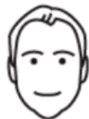
Revisor 32 år

At man har en rask og enkel tilgang til bilen gjør at man slipper å planlegge så lenge i forkant. Gir større fleksibilitet i hverdagen