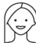
Småbarnsmor 42 år

Jeg kansellerte bestillingen av en e-golf da jeg fikk høre om denne tjenesten. Tror jeg har brukt bil 4-5 ganger i uken i sommer